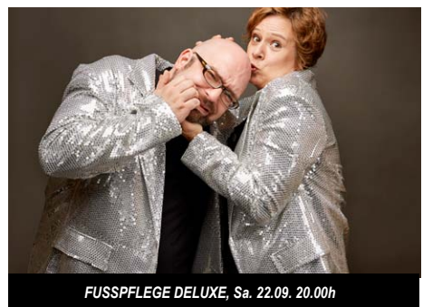
FUSSPFLEGE DELUXE, Sa. 22.09. 20.00h