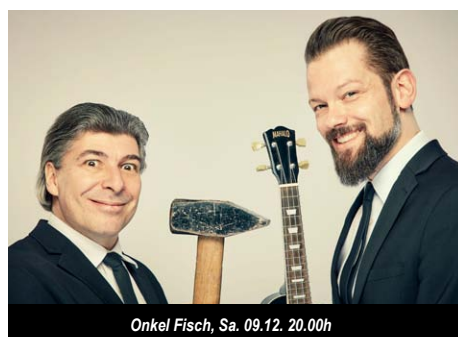
Onkel Fisch, Sa. 09.12. 20.00h