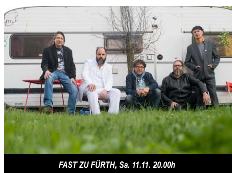
FAST ZU FÜRTH, Sa. 11.11. 20.00h