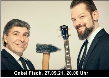
Onkel Fisch, 27.09.21, 20.00 Uhr

Das THEATER unter altbewährter Leitung und das BISTRO mit Ihrem neuem Schwung. Denn Nach-Corona kommt bestimmt!