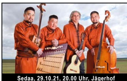
Sedaa, 29.10.21, 20.00 Uhr, Jägerhof