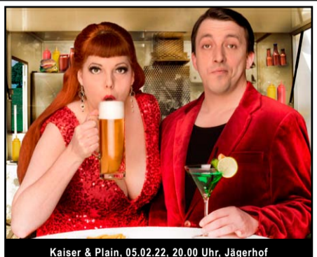
Kaiser & Plain, 05.02.22, 20.00 Uhr, Jägerhof

Mit freundlicher Unterstützung des Oberbergischen Kreises