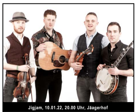
Jigjam, 10.01.22, 20.00 Uhr, Jägerhof