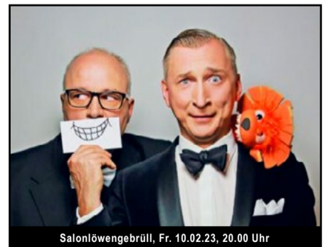
Salonlöwengebrüll, Fr. 10.02.23, 20.00 Uhr

Mit freundlicher Unterstützung des Oberbergischen Kreises