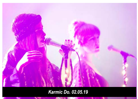
Karmic Do. 02.05.19